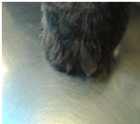
Le petit « pompon » restant après l'ablation.