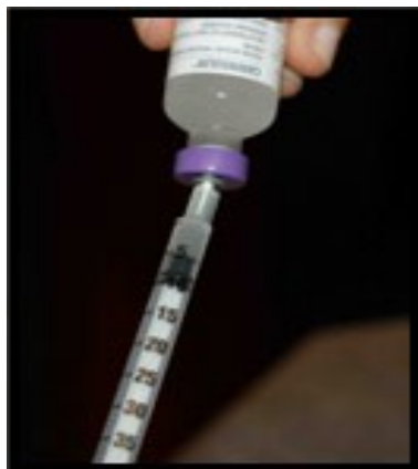
La piqûre et le flacon d'insuline.