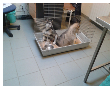
Les chiots, puis leur mère.