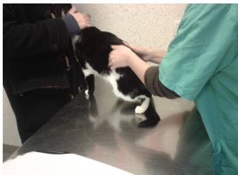
La docteur inspecte le train arrière de Tom.