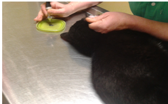
Le chat en train de se faire tatouer par la vétérinaire.

En arrivant l'après midi il y avait de l'animation à la clinique. En effet la première consultation concernait une portée de 7 Malamuts d'Alaska (chiens ressemblant à des Huskys) et leur mère. Il sont nés le 11 novembre 2012, leurs maîtres les amenaient pour les pucer et les tatouer.