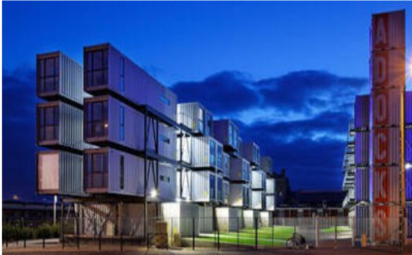
Résidence universitaire : Le Havre