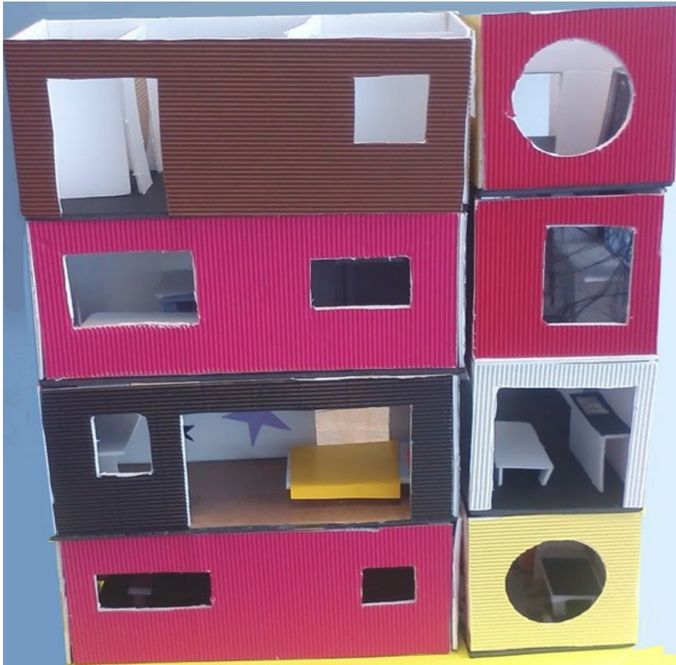
Résidence « André Chêne »