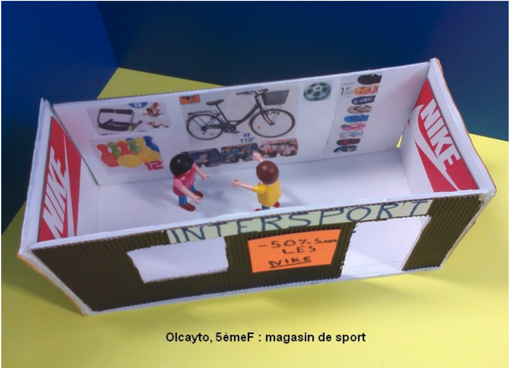
Olcayto, 5èmeF : magasin de sport